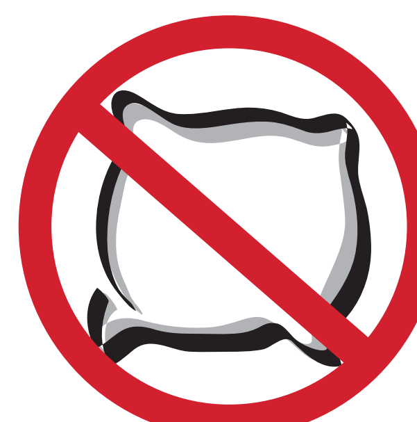
COUSSINS AVEC ARMATURE EN MÉTAL CUSHION WITH BACK REST