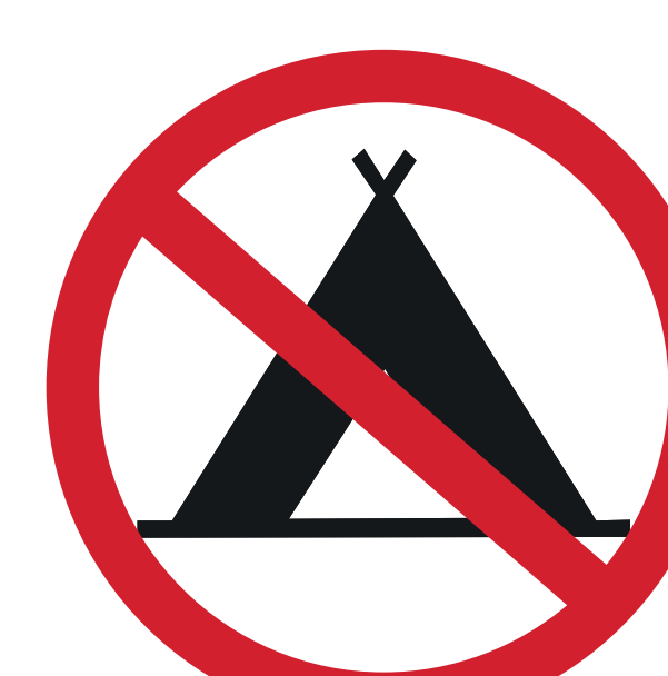
MATÉRIEL DE CAMPING CAMPING EQUIPMENT