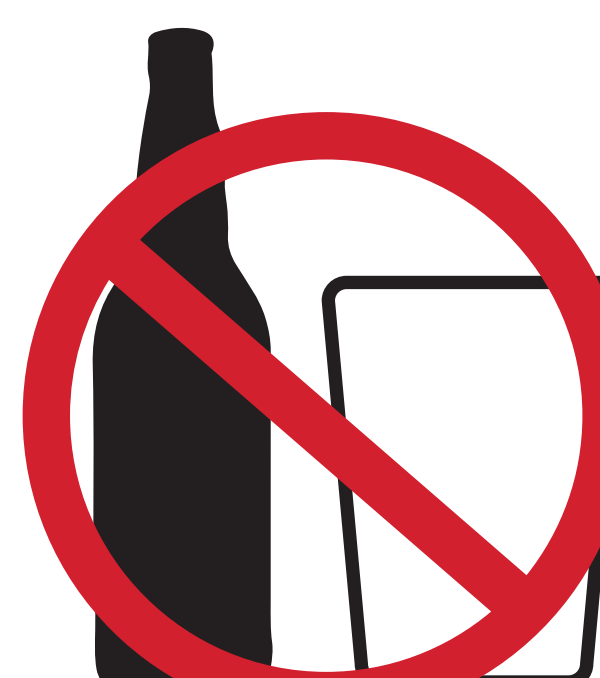
BOUTEILLES ET CONTENANTS EN VERRE BOTTLES AND GLASS CONTAINERS