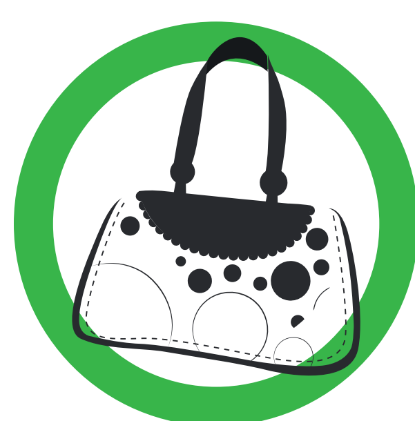
SACS À DOS ET SACOCHES DE PETIT FORMAT SMALL BACKPACKS AND BAGS