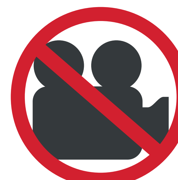
APPAREILS PHOTO ET CAMÉRAS PROFESSIONNELLES PROFESSIONAL VIDEO EQUIPMENT AND CAMERAS