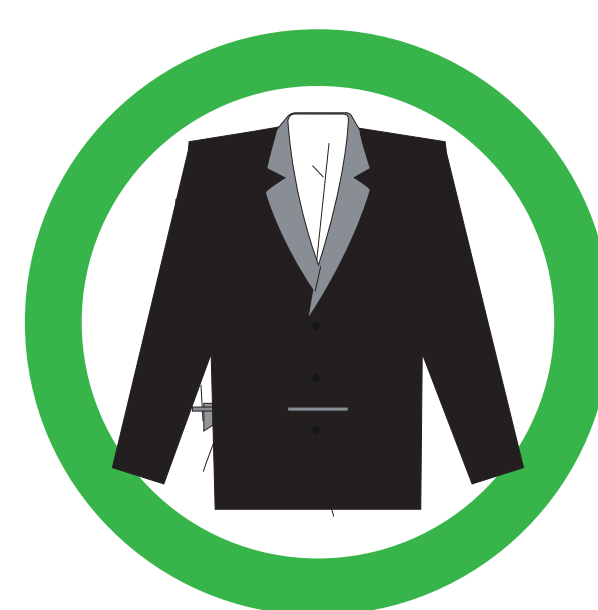
IMPERMÉABLE RAIN GEAR