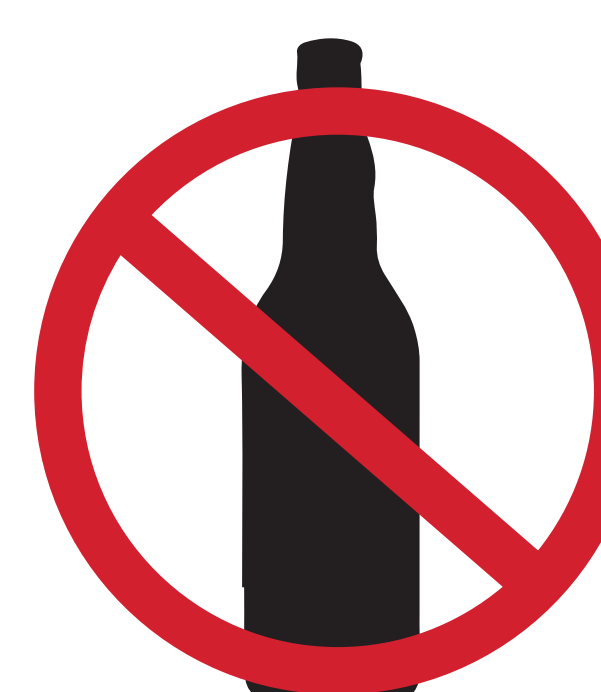
BOISSONS ALCOOLISÉES ALCOHOLIC BEVERAGES