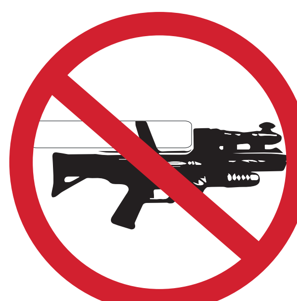
FUSILS À EAU WATER GUNS