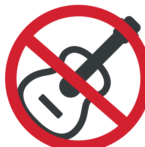
INSTRUMENTS DE MUSIQUE ET MÉGAPHONES MUSICAL INSTRUMENTS AND MEGAPHONES