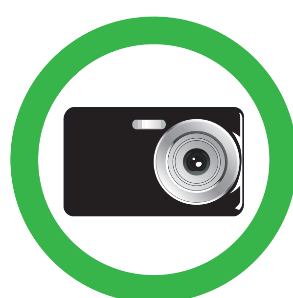
APPAREILS PHOTO ET CAMÉRAS NON PROFESSIONNELLES NON-PROFESSIONAL CAMERAS