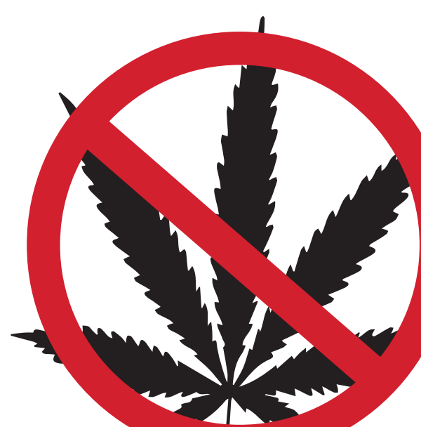
DROGUES (SAUF MÉDICAMENTS) DRUGS (EXCEPT PRESCRIPTION DRUGS)