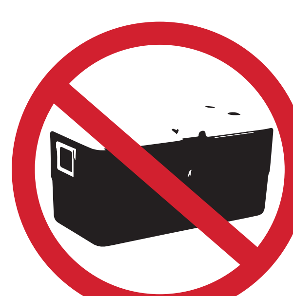
GLACIÈRES, THERMOS ET GOURDES RIGIDES COOLERS, THERMOSES OR RIGID WATER BOTTLES