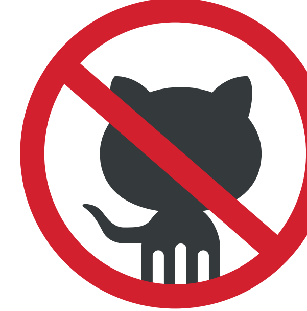
ANIMAUX (SAUF CHIEN-GUIDE) ANIMALS (EXCEPT GUIDE DOG)