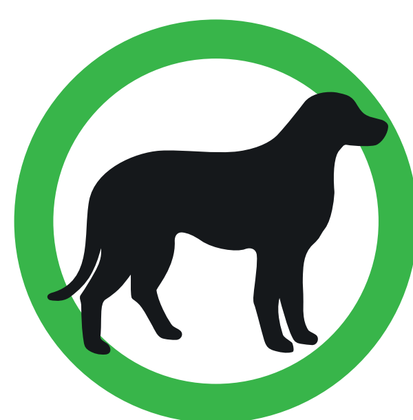
CHIEN-GUIDE GUIDE DOG