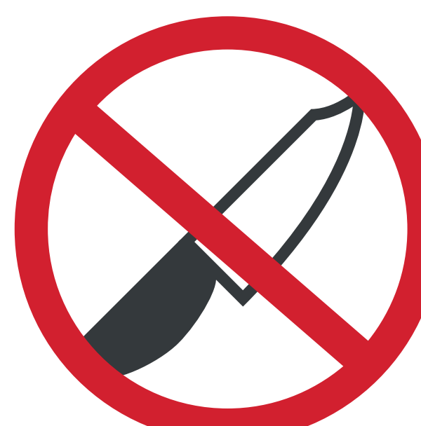
ARMES ET OBJETS CONTONDANTS WEAPONS AND SHARP OBJECTS