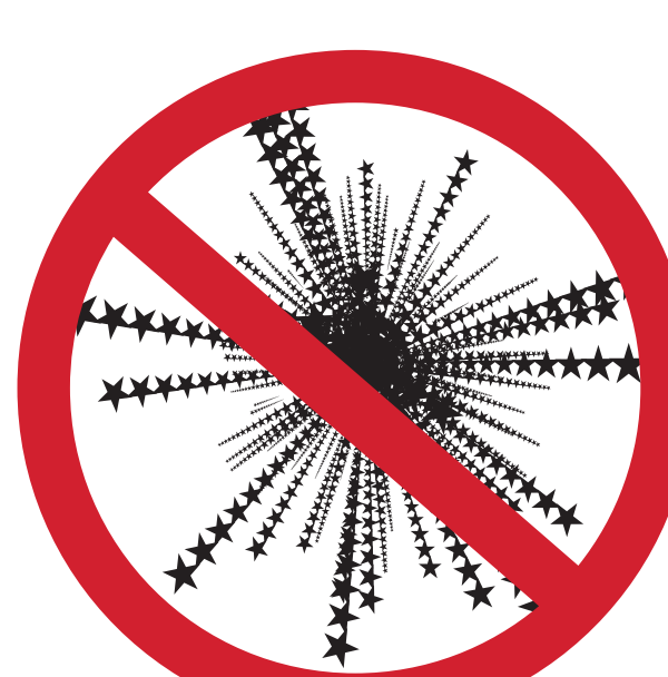
PYROTECHNIE FIREWORKS OR FIRECRACKERS