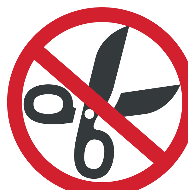
ITEMS POUVANT POSER UN DANGER À LA SÉCURITÉ DES AUTRES SPECTATEURS ITEMS THAT COULD REPRESENT A DANGER TO THE SAFETY OF OTHER SPECTATORS