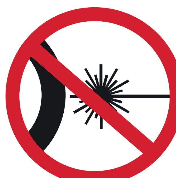
POINTEURS LASER LASER POINTERS