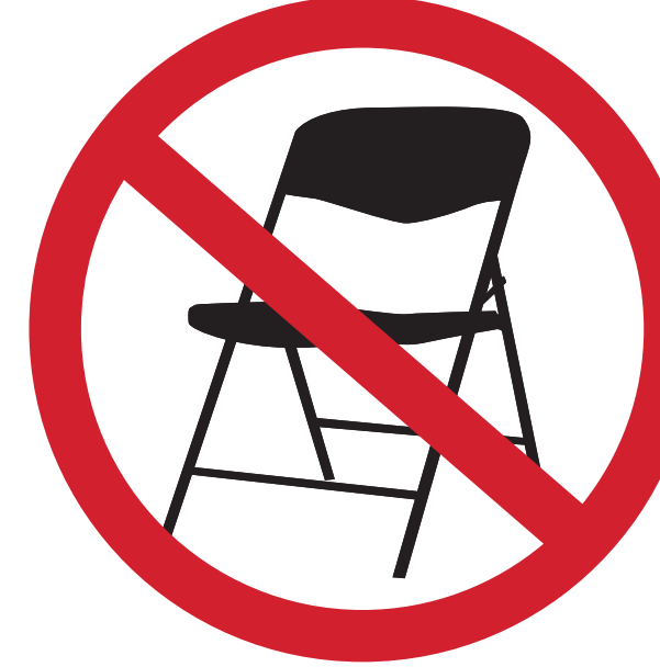
CHAISES PORTATIVES OU PLIANTES PORTABLE OR FOLDING CHAIRS