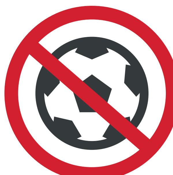
BÂTONS, BALLES, BALLONS DE TOUTES SORTES STICKS, BALLS OF ALL KINDS