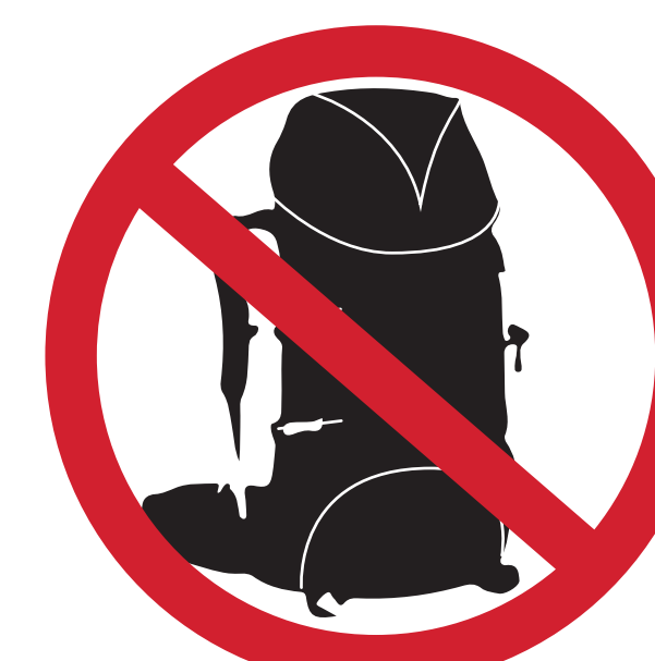
GRANDS SACS-À-DOS LARGE PACKSACKS