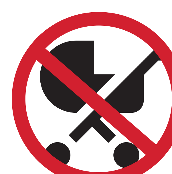
POUSSETTE POUR ENFANT STROLLER FOR CHILDREN